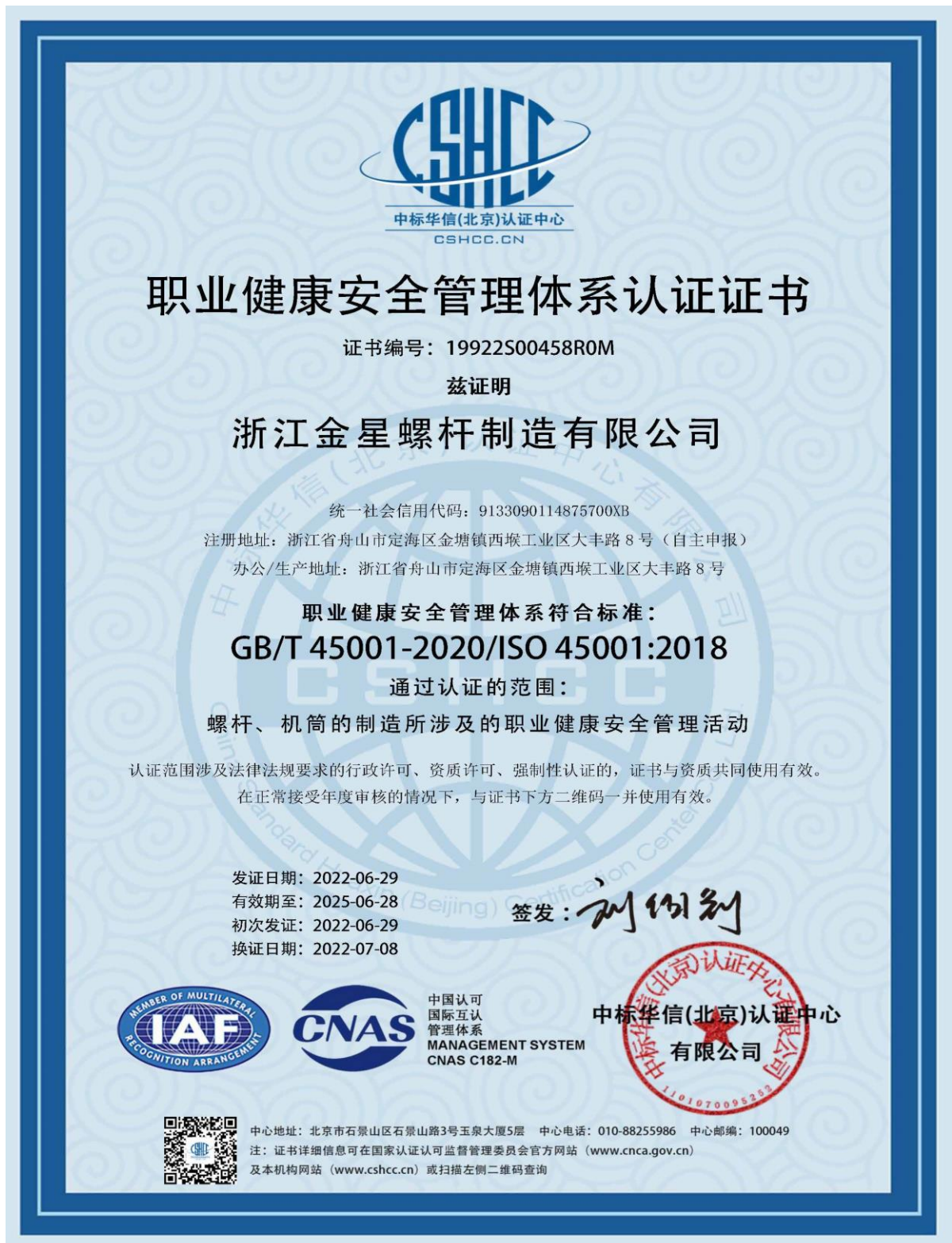
图表 8 职业健康安全管理体系证书