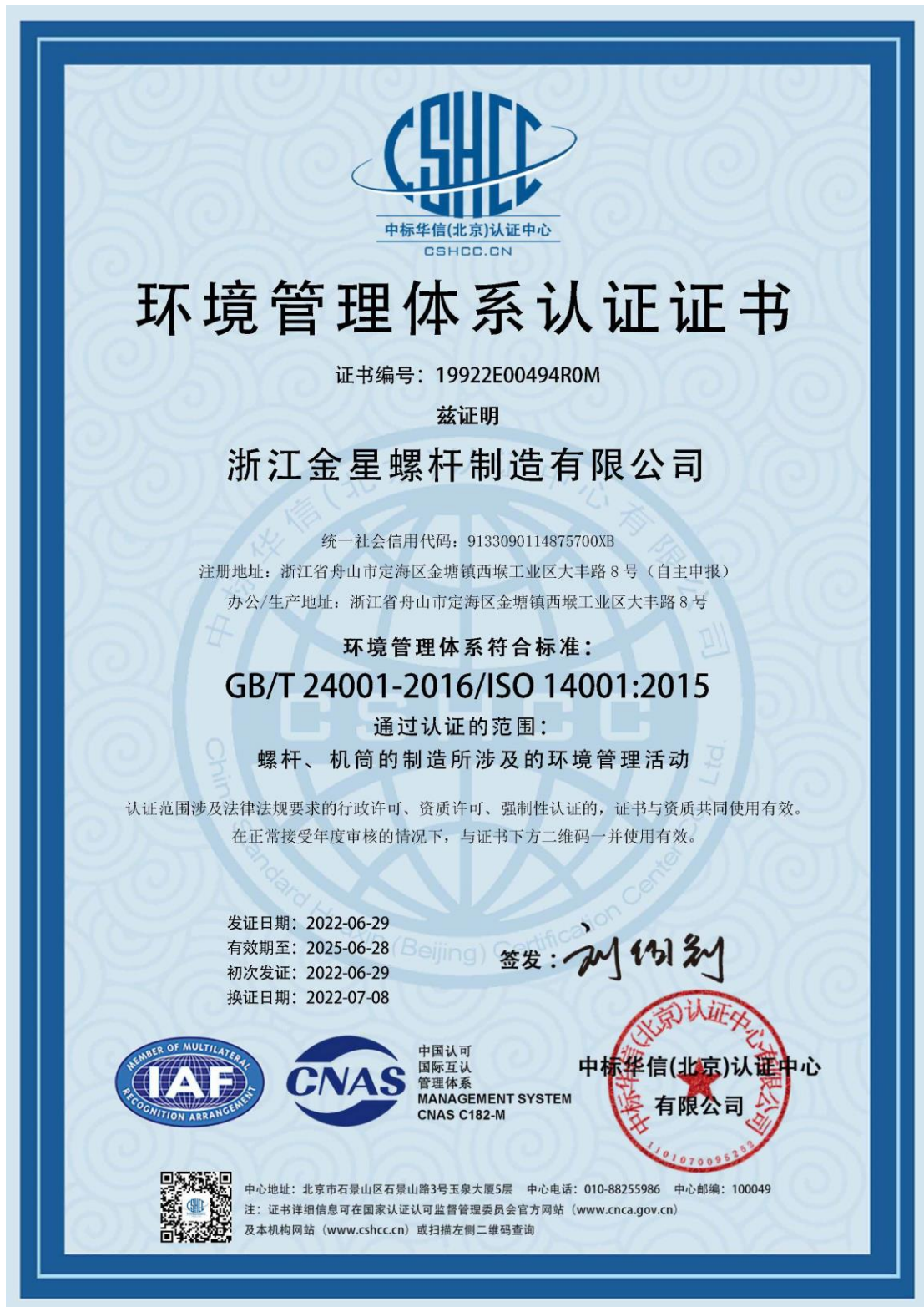
图表 7 环境管理体系证书